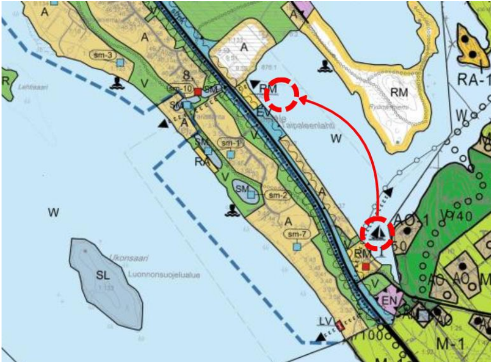
Kuva 2. Suunnittelualueen alustava rajaus punaisella katkoviivalla